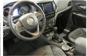
ASR Auto GmbH Gröbenzell