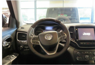
ASR Auto GmbH Gröbenzell