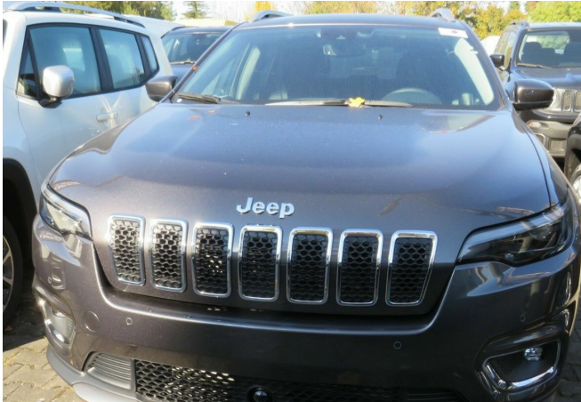
ASR Auto GmbH Gröbenzell