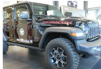
ASR Auto GmbH Gröbenzell