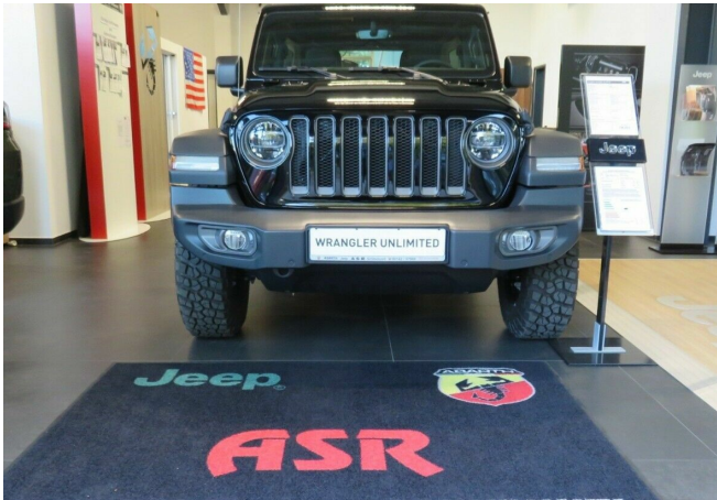
ASR Auto GmbH Gröbenzell