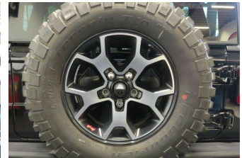
ASR Auto GmbH Gröbenzell