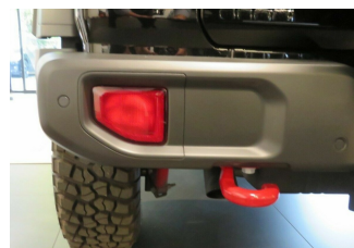
ASR Auto GmbH Gröbenzell